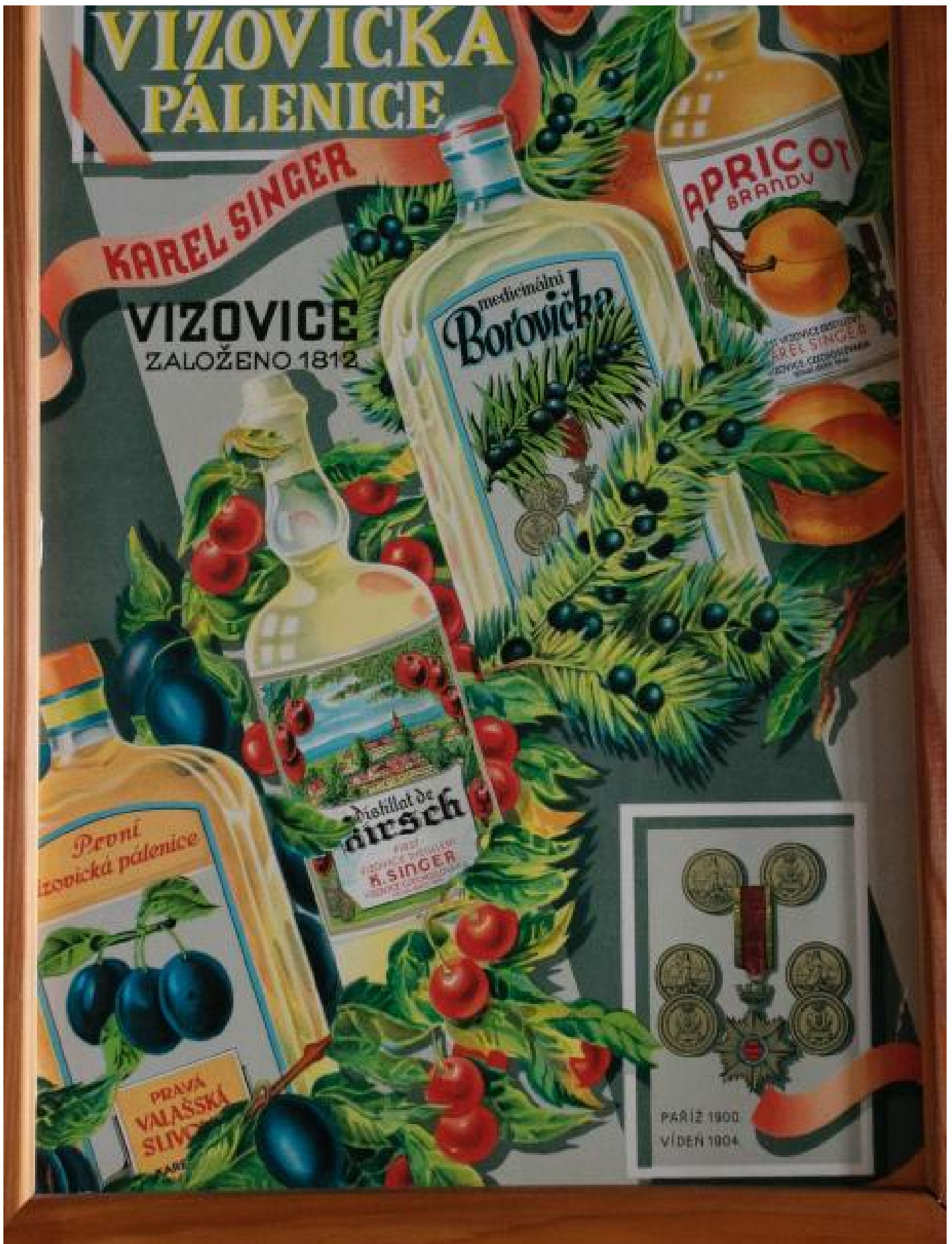
První vizovická pálenice Karel Singer

Když nejdou na odbyt švestky sušené, třeba půjdou tekuté, řekli si. Vedle domácích palíren tak rychle začaly vznikat i malé průmyslové podniky. V roce 1891 si jednu palírnu ve