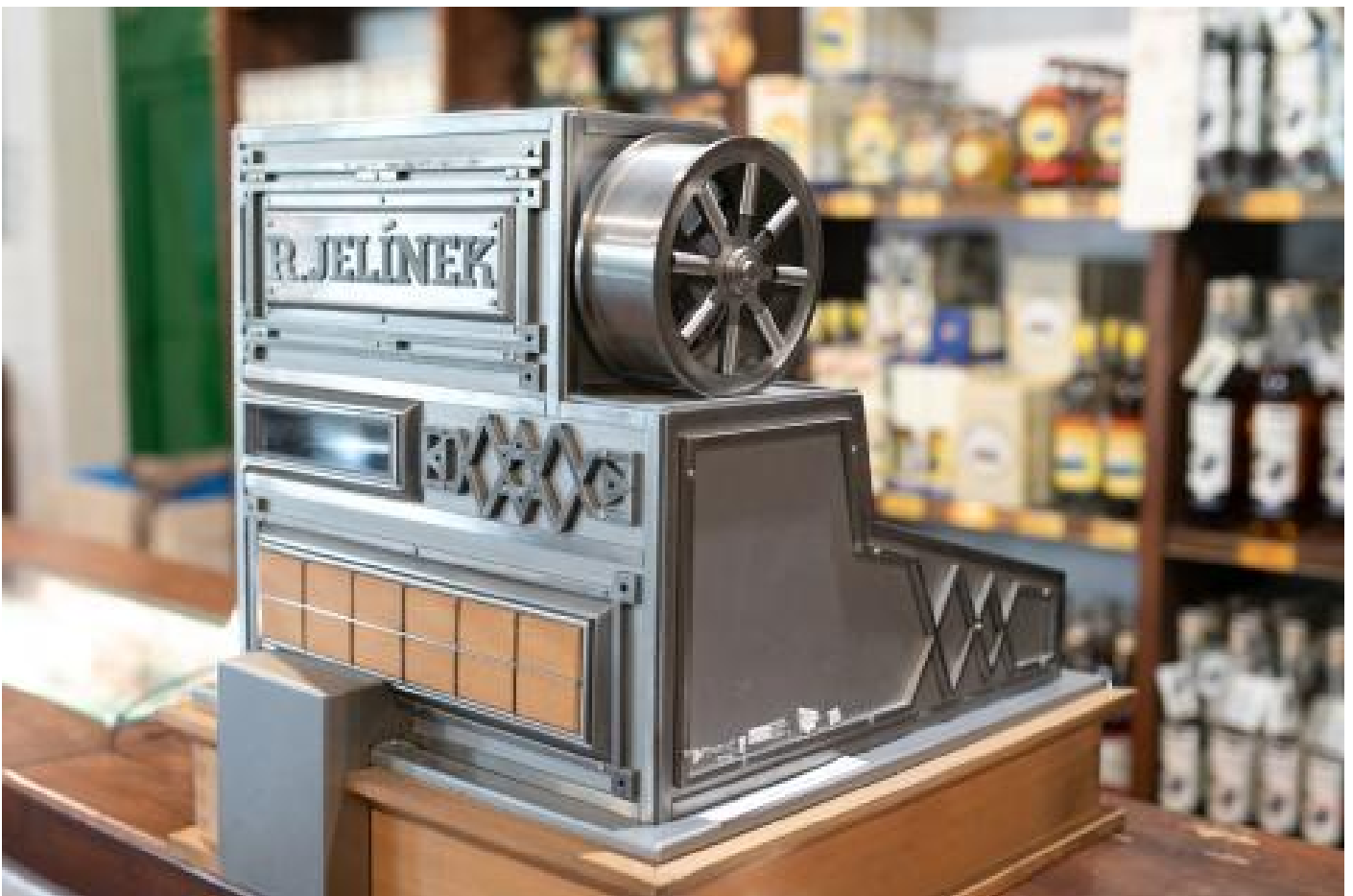
Palírna Rudolf Jelínek

V červnu 1891 byl „závod ku vyrábění kořalky“ schválen. Podniku se dařilo a firma sbírala ocenění na národopisných a průmyslových výstavách. Přes všechny úspěchy ale Singerově palírně zpočátku jen sotva dýchala na záda.